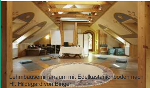
Lehnbauseminarraum mit Edelkastanienboden nach Hl. Hildegard von Bingen